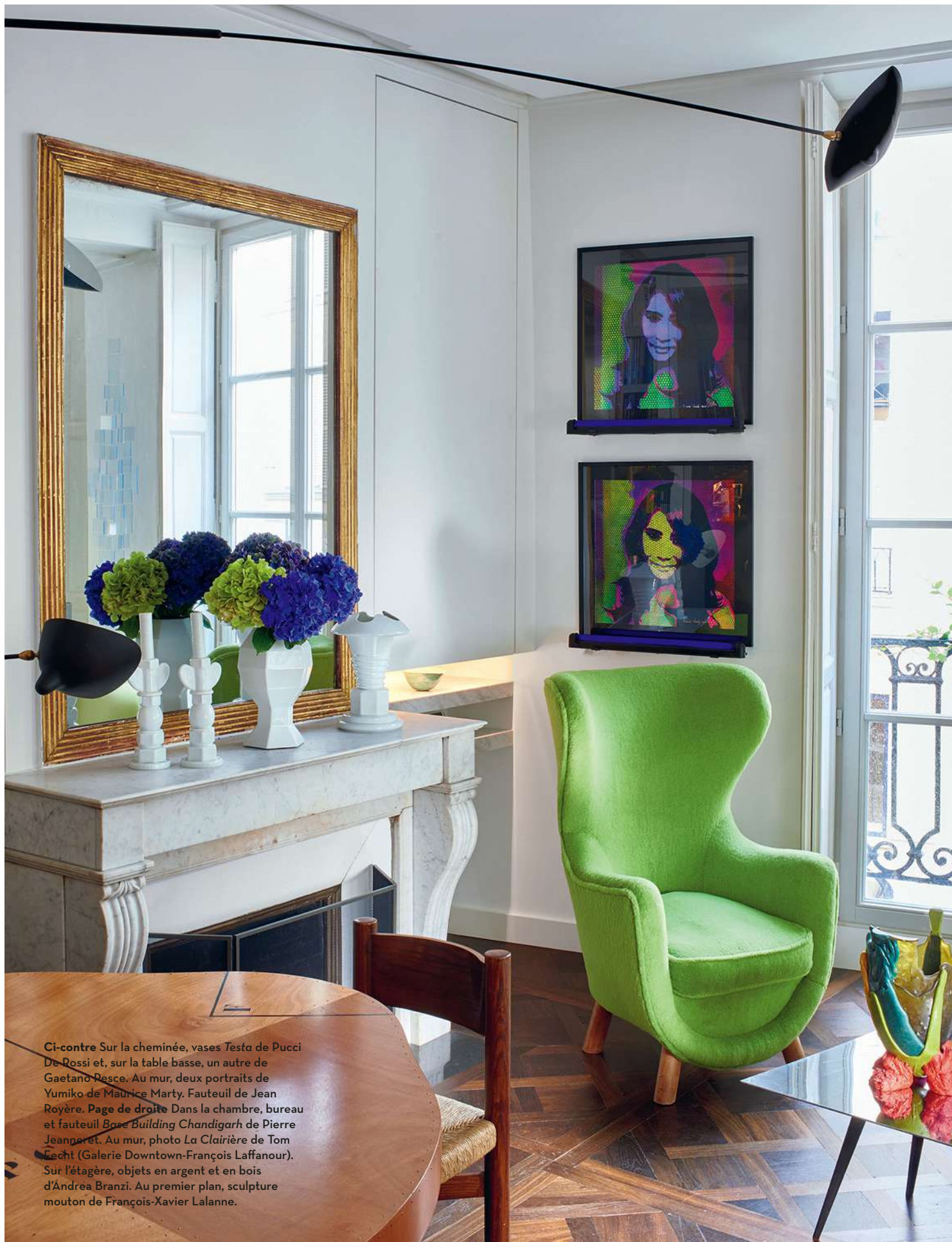
Ci-contre Sur la cheminée, vases Testa de Pucci De Rossi et, sur la table basse, un autre de Gaetano Pesce. Au mur, deux portraits de Yumiko de Maurice Marty. Fauteuil de Jean Royère. Page de droite Dans la chambre, bureau et fauteuil Base Building Chandigarh de Pierre Jeanneret. Au mur, photo La Clairière de Tom Ficht (Galerie Downtown-François Laffanour). Sur l'étagère, objets en argent et en bois d'Andrea Branzi. Au premier plan, sculpture mouton de François-Xavier Lalanne.